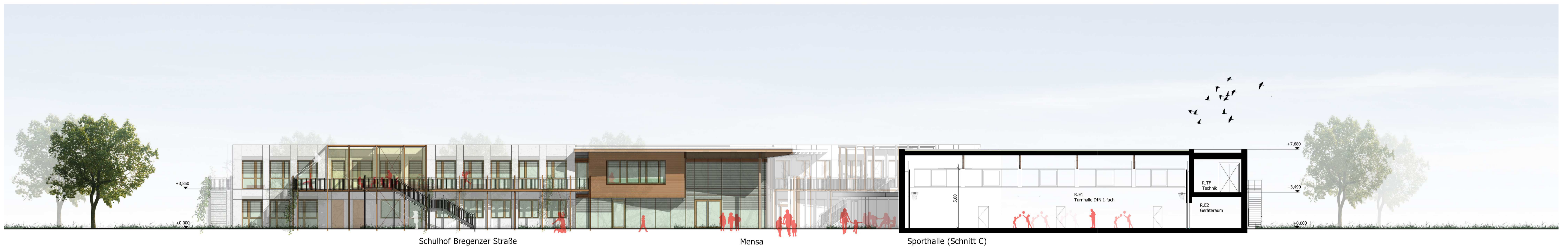
Ansicht Süd West M 1:200